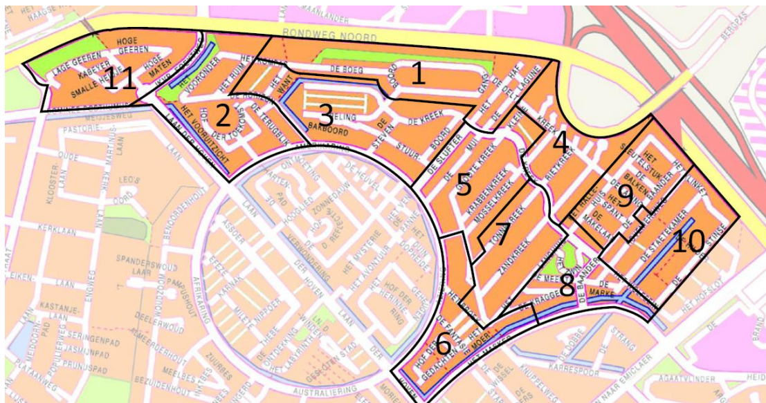
Fig 1.2 De omvang van het eerste gebied

De graafwerkzaamheden voor het eerste AP gebied gaan van start op 15 maart 2009 en lopen door tot juni. Half mei beginnen we met de huisaansluitingen. De volgorde van aansluiten is gebied 1, 2, 3, 4, 5, 7, 8, 9, 10, 6 en 11